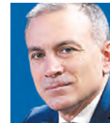
ΤΟΥ ΚΩΝΣΤΑΝΤΙΝΟΥ ΦΙΛΗ

Οι επιλογές των ΗΠΑ για την περιοχή της Ανατολικής Μεσογείου αποτελούν μέρος μιας ευρύτερης στρατηγικής, η οποία έγκειται στη δημιουργία μιας νέας συνθήκης πραγμάτων για την αποτελεσματικότερη αντιμετώπιση του κινεζικού ελέγχου ανά τον κόσμο. Απώτερος στόχος αυτής της προσέγγισης είναι η δημιουργία εστιών επιρροής, οι οποίες θα ξεπερνούν τα σύνορα της Δύσης και θα εκτείνονται γεωγραφικά μέχρι την περιοχή του Ινδικού και του Ειρηνικού για την αποτροπή του ενδεχομένου ανάληψης πρωταγωνιστικού ρόλου από την Κίνα σε περιοχές του άμεσου ενδιαφέροντός τους, καθώς επίσης και από τη Ρωσία σε περιοχές της Μέσης Ανατολής ή/και την Ανατολική Μεσόγειο. Οσον αφορά δε την τελευταία, δεδομένου του κενού που υπάρχει στην περιοχή, η Ελλάδα μέσω διευρυνόμενων σχημάτων προσπαθεί να προχωρήσει στην κάλυψη αυτού σε συνεννόηση με τις ΗΠΑ, αλλά και στον πολλαπλασιασμό του κόστους για την Τουρκία απέναντι σε οποιαδήποτε μελλοντική προκλητική ενέργεια εναντίον μας. Μέρος των εν λόγω προσπαθειών αποτελεί η Ελληνογαλλική Συμφωνία, η οποία εντάσσεται στη γενικότερη τάση που υπάρχει σήμερα, δηλαδή στην προτίμηση σχηματισμού περιφερειακών και μη διμερών ή πολυμερών συμπτάξεων, όπως εκείνων που υπάρχουν με την Αίγυπτο και το Ισραήλ, οι οποίες λειτουργούν συμπληρωματικά σε υπερεθνικά σχήματα, όπως το ΝΑΤΟ και η ΕΕ.