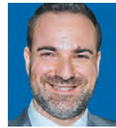
ΤΟΥ ΧΑΡΑΛΑΜΠΟΥ ΤΣΕΚΕΡΗ

Κ ατά την τελευταία περίοδο, η συζήτηση για το μέλλον, συχνά με τη δομημένη μορφή της «στρατηγικής προοπτικής διερεύνησης», έρχεται δυναμικά στο προσκήνιο, τόσο σε εγχώριο όσο και σε ευρωπαϊκό επίπεδο, δημιουργώντας έναν εντυπωσιακό πλούτο σεναρίων σχετικά με τα νέα μεγάλα διακυβεύματα. Τα διακυβεύματα αυτά αναφέρονται κυρίως σε «μεγατάσεις», όπως η κλιματική κρίση, η ψηφιοποίηση και η ραγδαία διάδοση της τεχνητής νοημοσύνης.