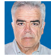
ΤΟΥ ΔΗΜΗΤΡΗ ΚΟΥΡΚΟΥΛΑΣ

Μια δίκαιη αποτίμηση της συνεισφοράς της ΕΕ στα δύσκολα χρόνια των πολλαπλών κρίσεων, οικονομική κρίση του 2009-10, κλιματική αλλαγή, προσφυγική κρίση, πανδημία, δεν πρέπει να γίνεται συγκρίνοντας ποια ήταν η κατάσταση προ κρίσεων και πώς είναι τώρα αλλά συγκρίνοντας πώς θα ήταν η σημερινή κατάσταση μας αν δεν υπήρχε η ΕΕ.