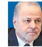
ΤΟΥ ΕΥΓΕΛΟΥ ΜΥΤΙΛΗΝΑΙΟΥ

Στο ερώτημα αν προχωράμε από την κρίση της πανδημίας στην κανονικότητα ή αν η κρίση που δημιουργήσε η πανδημία αποτελεί πλέον κανονικότητα και αφετηρία πολλών άλλων φαίνεται πως υπερσχύει η δεύτερη περίπτωση.