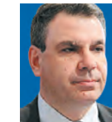
ΤΟΥ ΝΙΚΟΥ ΒΕΤΤΑ

Η προγραμματισμένη εισροή ευρωπαϊκών πόρων, κυρίως μέσω του Ταμείου Ανάκαμψης, αναμένεται να ενισχύσει σημαντικά τους ρυθμούς μεγέθυνσης της οικονομίας. Την περυσινή ύφεση 9% φαίνεται πως μπορεί να ακολουθήσει ισχυρή φετινή ανάκαμψη, λίγο μικρότερη, και στην επόμενη τριετία ετήσιοι ρυθμοί πραγματικής μεγέθυνσης περί το 3-4%. Στο διάστημα αυτό, συμβάλλουν θετικά η σταδιακή μείωση ανεργίας και επενδυτικού κενού, η διατήρηση των επιτοκίων χαμηλά και η ανάκαμψη της ζήτησης διεθνώς. Καθώς, όμως, θα επουλώνεται το πλήγμα της πανδημίας, τα ζητήματα που αφορούν τις μεσοπρόθεσμες προοπτικές της οικονομίας έρχονται στο προσκήνιο.