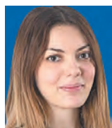
ΤΗΣ ΚΩΝΣΤΑΝΤΙΝΑΣ ΓΕΩΡΓΑΚΗ

Πέραν των τακτικών πόρων που θα λάβουμε από τον προσφάτως ψηφισθέντα – και πλέον γενναιόδωρο από την ίδρυση της Ευρωπαϊκής Ένωσης – ενωσιακό προϋπολογισμό, εντός των επόμενων ετών η Ελλάδα πρόκειται να επωφεληθεί και από την έκτακτη χρηματοδότηση του Ταμείου Ανάκαμψης και Ανθεκτικότητας. Το Ταμείο, το οποίο αποτελεί το ενωσιακό εργαλείο αντιμετώπισης των οικονομικών και κοινωνικών επιπτώσεων της υγειονομικής κρίσης της Covid-19, αναμένεται να παράσχει στα κράτη μέλη επιχορηγήσεις και δάνεια, με τους πόρους του να προέρχονται από δανεισμό της ίδιας της Ένωσης από τις διεθνείς κεφαλαιαγορές.