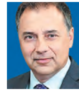
ΤΟΥ ΘΕΟΔΩΡΟΥ ΠΕΛΑΓΙΑΗ