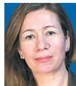
ΤΗΣ ΚΑΤΕΡΙΝΑΣ ΣΩΚΟΥ

Η αμερικανική κυβέρνηση προσπαθεί να αποκαταστήσει το κύρος της που επλήγη από τις αστοχίες της εξόδου από το Αφγανιστάν διευρύνοντας τη συνεργασία με τους συμμάχους της. Εντατικές διαβουλεύσεις έκανε και για την αποκατάσταση της εμπιστοσύνης στις σχέσεις της με τη Γαλλία, καθώς η συμφωνία για τα πυρηνικά υποβρύχια με την Αυστραλία, αν και σύμφωνη με τις προτεραιότητες των ΗΠΑ στον Ειρηνικό, προκάλεσε προβληματισμό στους κόλπους της Συμμαχίας για τον χειρισμό ενός ευρωπαϊού εταίρου. Η διπλωματική προσέγγιση ήταν επιτυχής και είχε αποτέλεσμα μία σειρά από ανακαινώσεις για την ενίσχυση της συνεργασίας Γαλλίας - ΗΠΑ.