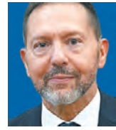
ΤΟΥ ΓΙΑΝΝΗ ΣΤΟΥΡΝΑΡΑ

Το βασικό ερώτημα που απασχολεί σήμερα τη διεθνή οικονομία και αφορά άμεσα και την Ελλάδα είναι το εξής: Θα υπερβεί ο ρυθμός μεταβολής του Δείκτη Τιμών Καταναλωτή τον στόχο για τον πληθωρισμό (2%) σε μεσοπρόθεσμο ορίζοντα (δηλαδή τα επόμενα δυο με τρία χρόνια) λόγω της νομισματικής και δημοσιονομικής επέκτασης, της μετατροπής των συσσωρευμένων, από την πανδημία, αποταμιεύσεων σε δαπάνες, της αύξησης των τιμών της ενέργειας (π.χ. από τις στενότητες στην αγορά φυσικού αερίου αλλά και των ποικίλων γεωπολιτικών εντάσεων), καθώς και λόγω της αύξησης των μισθών; Αν η απάντηση είναι θετική, τότε θα αυξηθούν τα επιτόκια. Αν αυξηθούν παράλληλα τα επιτόκια και ο ονομαστικός ρυθμός αύξησης του ΑΕΠ, το πρόβλημα είναι αντιμετώπισιμο. Αν αυξηθούν τα επιτόκια αλλά υπάρξει στασιμότητα στον ρυθμό μεταβολής του ονομαστικού ΑΕΠ, το πρόβλημα επιδεινώνεται.