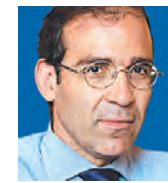
ΤΟΥ ΓΙΩΡΓΟΥ ΠΑΓΟΥΛΑΤΟΥ

Τα μεγάλα διλήμματα για την ΕΕ αφορούν κατεξοχήν τομείς στους οποίους αποφασίζει με ομοφωνία. Κι επειδή η ομοφωνία δεν προβλέπεται να εκλείψει, τα διλήμματα θα παραμείνουν.