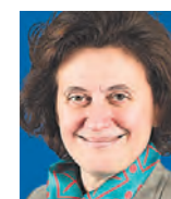
ΤΗΣ ΙΝΩΣ ΑΦΕΝΤΟΥΛΗ

Τα διεθνή γεγονότα των τελευταίων ετών αναδεικνύουν μια αυξανόμενη αστάθεια παγκοσμίως και δημιουργούν αβεβαιότητα ως προς την αποτελεσματικότητα των θεσμών που είναι επιφορτισμένοι με τη διατήρηση της σταθερότητας σε παγκόσμια κλίμακα. Τα αίτια της αστάθειας είναι πολιτικά και μη, για παράδειγμα η πανδημία ή η κλιματική κρίση. Προεξάρχον πολιτικό αίτιο αποτέλεσε ο λαϊκισμός όπως εκδηλώθηκε στις κάρες-πυλώνες του διεθνούς συστήματος, στις ΗΠΑ με την ανάδειξη του Τραμπ και στη Βρετανία με το Brexit. Είναι δείγμα υγείας του αμερικανικού πολιτικού συστήματος ότι απαλλάχθηκε από τον Τραμπ, δεν είναι ωστόσο βέβαιο ότι η βαθιά διαίρεση της αμερικανικής κοινωνίας θα εκλείψει.