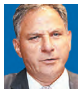
ΤΟΥ ΜΙΛΤΙΑΔΗ ΝΕΚΤΑΡΙΟΥ

Η χώρα διαθέτει έναν πλήρη οδικό χάρτη για τη δομή και το περιεχόμενο της απαιτούμενης μεταρρύθμισης του ΕΣΥ. Η σχετική μελέτη έχει γίνει από επτά καθηγητές που προέρχονται από πέντε πανεπιστήμια της χώρας και έχει δημοσιευτεί από τη διανεμοσις.