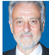
ΤΟΥ ΛΟΥΚΑ ΤΣΟΥΚΑΛΗ

Ζούμε σε μια εποχή μεγάλων αλλαγών και τεράστιας αβεβαιότητας στον διεθνή χώρο. Είναι μια εποχή που το κέντρο βάρους μετακινείται ολοένα και περισσότερο προς την Ασία και τον Ειρηνικό Ωκεανό. Οι Ηνωμένες Πολιτείες εστιάζουν την εξωτερική τους πολιτική στην Κίνα που αποτελεί πλέον για τους Αμερικανούς τον νέο μεγάλο κίνδυνο. Ενώ η Ευρώπη, που έχασε τον κεντρικό της ρόλο μετά το τέλος του Ψυχρού Πολέμου, ψάχνει ακόμη τρόπους για να κερδίσει τη λεγόμενη στρατηγική αυτονομία. Στη δική μας άμεση γειτονία, η Ανατολική Μεσόγειος παραμένει μια περιοχή μεγάλης αστάθειας που θα κάνει βαθμιαία τη στρατηγική της σημασία λόγω του περιορισμένου ρόλου που θα έχουν οι υδρογονάνθρακες στο μέλλον. Η Τουρκία επιδιώκει ρόλο περιφερειακής δύναμης και τα Βαλκάνια βρίσκονται σε τέλμα από το οποίο δύσκολα θα βγουν χωρίς τη βοήθεια της Ευρώπης.