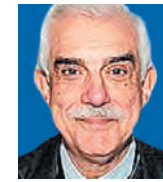
ΤΟΥ ΓΙΑΝΝΗ ΚΑΛΟΓΗΡΟΥ

Παρά τα πρόσφατα σημάδια ανάκαμψης της ελληνικής οικονομίας και την εύλογη προσμονή της πρόκλησης των ευρωπαϊκών πόρων, ο μακροχρόνιος κίνδυνος στο παραγωγικό επίπεδο είναι η αναπαραγωγή του υφιστάμενου παραγωγικού και επιχειρηματικού ιστού, παρά τη διαθεσιμότητα ενός πρωτόγονου ύψους ευρωπαϊκής χρηματοδότησης. Και όμως το στρατηγικό αναπτυξιακό διακύβευμα της χώρας είναι η τεχνολογική και οργανωτική αναβάθμιση, η αναδιάρθρωση και εν τέλει ο μετασχηματισμός του παραγωγικού της συστήματος με δύο στόχους: α) να μπορέσει να συμβάλει στη βελτίωση της διαρθρωτικής ανταγωνιστικότητας της ελληνικής οικονομίας, η οποία εδώ και πάνω από μία δεκαετία έχει καταρρυθμιστεί δεκάδες θέσεις σε διάφορες κατατάξεις της διεθνούς ανταγωνιστικότητας (World Economic Forum, IMD κ.ά.) και β) να διευκολύνει τον σταδιακό απεγκλωβισμό των ελληνικών επιχειρήσεων από τη στρατηγική θέση «stuck in the middle» (κολημημένες στη μέση) στο πεδίο του διεθνούς ανταγωνισμού – καθώς είναι στην πλειονότητά τους ακριβότερες από επιχειρήσεις που προέρχονται από χώρες χαμηλού κόστους εργασίας, αλλά και ποιοτικά λιγότερο ανταγωνιστικές από επιχειρήσεις που προέρχονται από οικονομίες υψηλότερων τεχνολογικών, παραγωγικών και οργανωσιακών δυνατοτήτων.