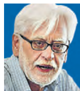
ΤΟΥ ΓΙΩΡΓΟΥ ΠΡΟΚΟΠΑΚΗ

Το Ταμείο Ανάκαμψης είναι μια παρέμβαση γιγαντιαίων διαστάσεων για τα ελληνικά δεδομένα – με την αναμενόμενη μόχλευση αντιστοιχεί σε 7% του ΑΕΠ κάθε χρόνο επί μια πενταετία. Ισοδυναμεί με την εκτέλεση 50 έργων σαν την Αττική Οδό σε μια πενταετία και παράλληλα 3.000 επιχειρήσεις εκτελούν επενδυτικά έργα 10 εκατομμυρίων ευρώ η καθεμία. Από τον προγραμματισμό μέχρι την ολοκλήρωση σε μόνο πέντε χρόνια, ενώ παράλληλα θα «τρέχει» το νέο ΣΠΔ.