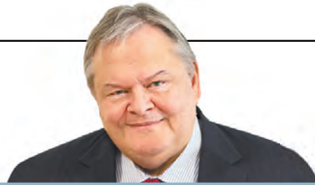
ΤΟΥ ΕΥΑΓΓΕΛΟΥ ΒΕΝΙΖΕΛΟΥ