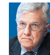
ΤΟΥ ΤΑΣΟΥ ΓΙΑΝΝΙΤΣΗ

Ο ι κοινωνίες μας έχουν ξεχάσει ότι τις δυσκολίες τις παλεύεις. Με κάθε νέο πρόβλημα πολλοί δυσφορούν – λογικό –, ψάχνουν ευθύνες σε «άλλους» και σωτήρες από οπουδήποτε. Κουρασμένοι από τόσα χρόνια κρίσης, ζούμε ξανά ένα διάχυτο κλίμα έωλης υπεραισιοδοξίας και προσδοκιών.