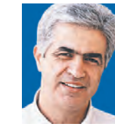
ΤΟΥ ΛΕΥΤΕΡΗ ΚΟΥΣΟΥΛΑΣ

Με πολύ ενδιαφέροντα και πρωτότυπο τρόπο, με μια έρευνα χρήσιμη για την καταγραφή πολιτικών επιλογών και προτιμήσεων, ο Στράτος Φαναράς θέτει στη συζήτηση, ως μέσο-πολιτικό δεδομένο, όπως απρόσφορα εκτιμή ορίστηκε, το ζήτημα «αυτοδυναμία ή κυβερνήσεις συνεργασίας».