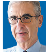
ΤΟΥ ΓΙΩΡΓΟΥ ΠΡΕΒΕΛΑΚΗ

Η αποχώρηση των Αμερικανών από το Αφγανιστάν και η συμφωνία ΑΚΥΚΣ δημόσησαν την εντύπωση ότι οι Ηνωμένες Πολιτείες αδιαφορούν για τους ευρωπαϊκούς συμμάχους τους. Στην πραγματικότητα οι κινήσεις αυτές εντάσσονται σε μια στρατηγική αναδιοργάνωση.