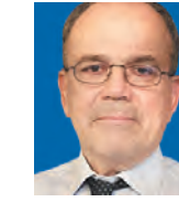
ΤΟΥ ΑΛΕΚΟΥ ΚΡΗΤΙΚΟΥ

Στην ειδοσιογραφία και στις σχετικές αναλύσεις για το Ταμείο Ανάκαμψης κυριάρχησε – εν πολλοίς δικαιολογημένα – το μέγεθος της πρόσθετης χρηματοδότησης που εξασφαλίζει και οι αναμενόμενες σημαντικές θετικές επιπτώσεις σε μια σειρά από δημοσιονομικά μεγέθη των ωφελούμενων κρατών-μελών. Αυτό είχε σαν συνέπεια την de facto υποτίμηση της πολιτικής σημασίας που έχει η εισαγωγή αυτού του μηχανισμού για τις ευρωπαϊκές εξελίξεις, που κατά την εκτίμησή μας, θα αποδειχθεί μεγαλύτερη από την οικονομική.